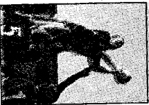
Una rimessa in gioco

Dominguez) alle meno suggestive ma non per questo più semplici sfide di serie B e della storica Amatori, rifondata nel 2002. Un pezzo di Milano gioca ancora ad altissimi livelli, quello confuito e digerito dal Calvisano nel 1998, ma la forte affluenza di bambini e giovanissimi in avvicinamento allo sport più affascinante del momento fa sperare in un futuro che, in qualche modo, possa far rivivere il passato.